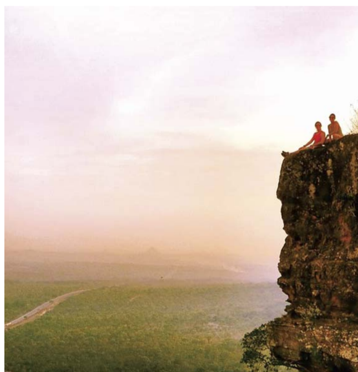
Mapeamento identificará novos pontos turísticos na Chapada das Mesas, que abrange os municípios de Carolina, Riachão, Balsas e Tasso Fragoso

A região da Chapada das Mesas apresenta um cenário ideal para a